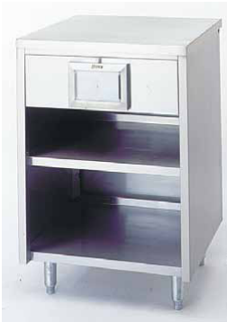
VS600NAP UNIDAD SERVILLETAS 600 x 550 x 890 mm