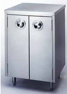
VS600CUPB ARMARIO DOBLE 600 x 550 x 890 mm