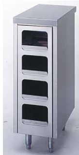
VS300CON CONDIMENTOS 300 x 550 x 890 mm