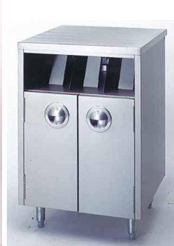
VS600WRAP1/4 EMPAQUETADO SIMPLE 600 x 550 x 890 mm