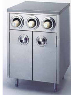
VS600CUP3 ARMARIO Y PORTAVASOS 600 x 550 x 890 mm