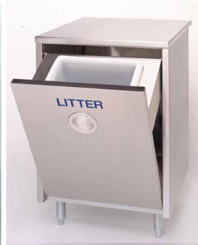
VS600LITTER CUBO DE BASURA 600 x 550 x 890 mm