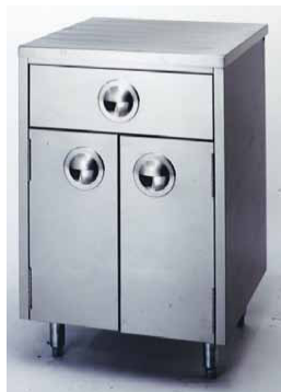
VS600DR CAJÓN MÁS ARMARIO 600 x 550 x 890 mm