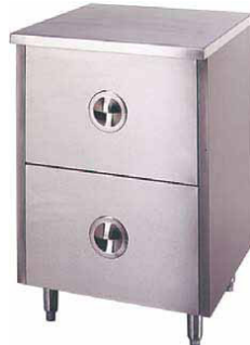
VS600CUPB DOBLE CAJÓN 600 x 550 x 890 mm