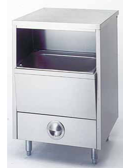
VS600ICE SENO PARA HIELO 600 x 550 x 890 mm