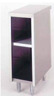
VS300/VS600 ESTANTERÍA VS300 300 x 550 x 890 mm VS600 600 x 550 x 890 mm