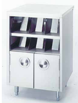
VS600WRAP 2/4 DOBLE EMPAQUETADO 600 x 550 x 890 mm